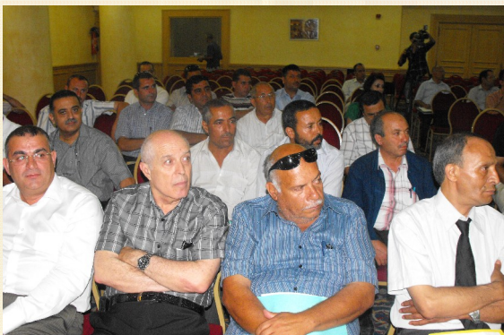
Environ 300 participants étaient présents à cette manifestation