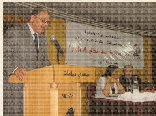
Discours d'ouverture de M. M.Jellali.