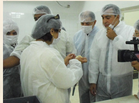
Visite de la SOTAVI

M Mokhtar Jellali, Ministre de l'Agriculture et de l'Environnement et M Mehdi Houas Ministre du Commerce et du tourisme étaient présents lors d'une visite organisée conjointement entre les deux ministères concernés, le 28 juillet 2011 dans la région du cap Bon pour s'enquérir des préparatifs du mois de Ramadhan en matière d'approvisionnement en produits sensibles et des stocks de sécurité. A cette occasion, deux d'exploitations avicoles ont été visitées, à savoir la SOTAVI et la SEPAG. Cette tournée a d'autre part concerné une centrale laitière à Soliman ainsi que le marché municipal de Menzel Bouzelfa.