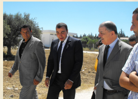
Visite de la SEPAG

✉ GIPAC – 8 rue Ali Ibn Abi Taleb Le Belvédère 1002 Tunis – Tunisie ☎ (216)71847705 📠 (216)71845988 e-mail: gipac@gipac.tn Site web: www.gipac.tn