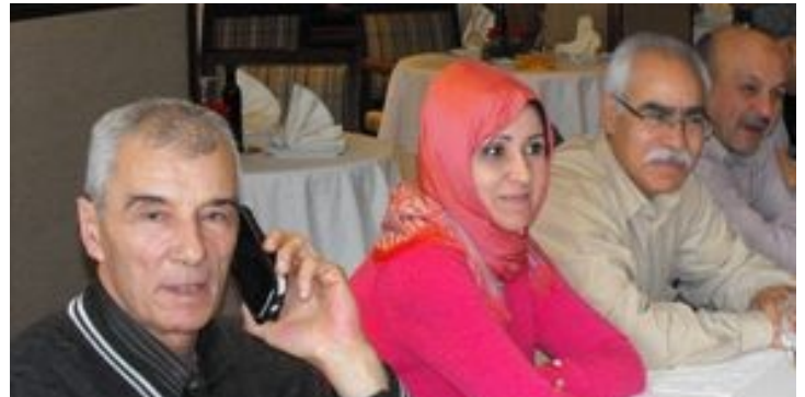
Quelques membres de la commission de pathologie aviaire

Il a été souligné que le virus de la maladie de New castle circulant au niveau de nos élevages avicoles était vélogène, et qu'il s'avère nécessaire de renforcer le protocole de vaccination du cheptel contre la maladie de new castle avec notamment une primo-vaccination au couvoir . Il est aussi recommandé de faire un contrôle sérologique de l'efficacité de cette vaccination. La commission a aussi indiqué que cette vaccination devrait être obligatoire pour tous les couvoirs. Par ailleurs, le problème de sous déclaration de mortalités a été soulevé et cela pose un vrai problème de suivi et d'évaluation de pertes économiques dues à la maladie.