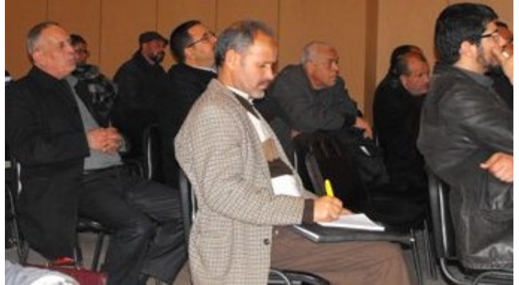
Vétérinaires exerçant dans le secteur lors de la conférence