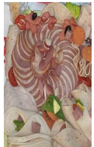
Promotion produits « Salima » SAVOL