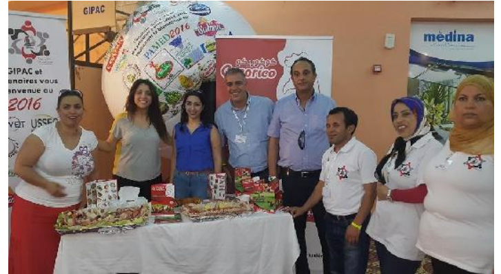
Promotion produits « COCORICO » ESSANIA