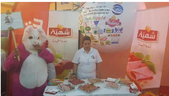
Promotion produits CHAHIA