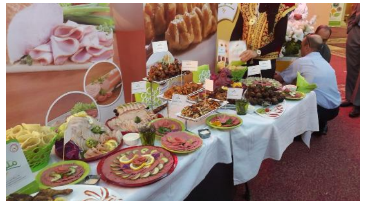
Promotion produits « MLIHA » SOPAT