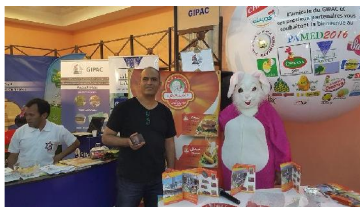
Promotion produits « Dhayaati » SOPROVAM