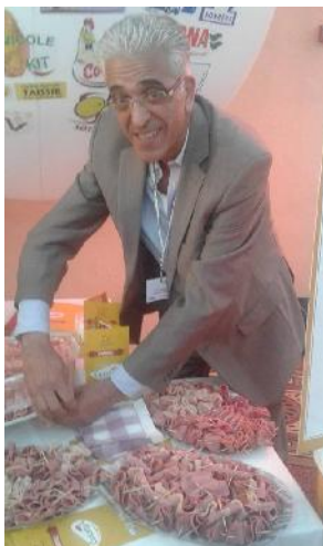
Promotion produits « Cuistot » GHRAIEB