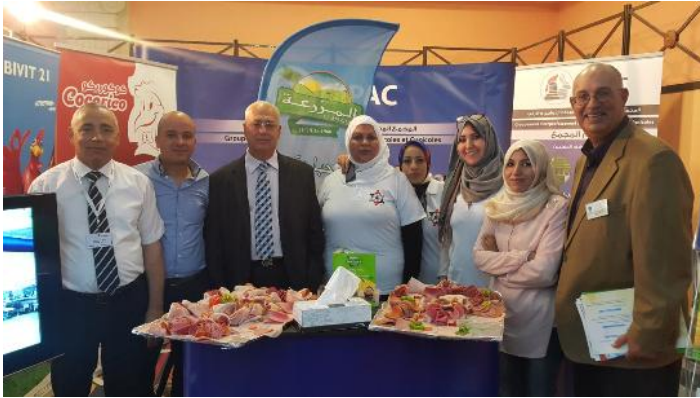
Promotion produits El MAZRAA