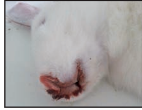
نزيف الأنف