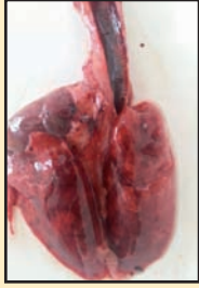
نزيف في القصبة الهوائية