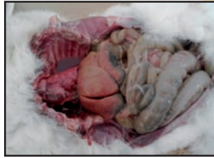
التهاب الكبد (صورة د. سفيان الصغير)